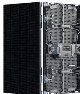
Dazzle Plus500*1000 Curve Cabinet