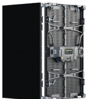
Dazzle Plus500*1000 Straight Cabinet